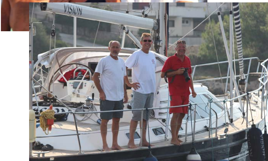
Dream Team auf der SY Vision