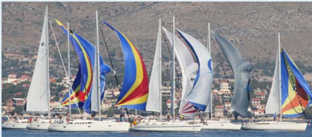
AMS Yachting Martin Luther Str.10 D97461 Hofheim