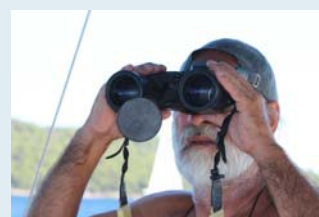
Milan AMS Crew Die Yachten fest im Blick

Samstag, der 1. Oktober 2011 - Anreise der Crews zum AMS Cup 2011. Wie immer beim AMS Cup strahlend blauer Himmel und Temperaturen von 25° begeistern alle anreisenden Regattateilnehmer. Der Titelverteidiger Team Bleicken ist am Start und ebenso die weiteren 10 platzierten Crews aus dem Regattajahr 2010. Der Stützpunkt Trogir ist bestens vorbereitet, so dass Begrüßung und Eincheck zügig durchgeführt werden. Am Abend steigt unter freiem Himmel bei angenehmen Temperaturen die Begrüßungsparty im Yachtclub Seget Trogir. Bei guter Stimmung freuen sich die Skipper und Crews auf die bevorstehenden Wettfahrten und die Wiedersehensfreude unter den altbekannten Crews ist riesengroß. Viele Segler sind seit der ersten Regatta 1994 dabei und kennen sich seit mehr als 18 Jahren. Die Crews reisten von Kiel bis Bodensee und von Berlin bis aus dem Saarland an. Unsere Segelfreunde aus Österreich waren stark vertreten und der Dientner Segelclub konnte sein 20-jähriges Jubiläum feiern. Die Sieger 2011 kamen aus Kiel und der Schweiz und gewannen den AMS Cup bereits zum 3. Mal. Gute Laune war bei diesem Wetter die ganze Woche vorprogrammiert und alle Crew's traten am Samstag, den 6. Oktober mit Vorfreude auf den nächsten AMS Cup in Vrsar die Heimreise an.